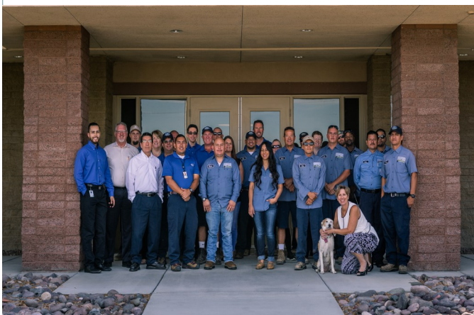
Your VSD staff ~ Su personal de VSD

Mediante la implementación de un nuevo logotipo y aspecto, VSD será más capaz de involucrar al público con información educativa e interesante que inspirará un mayor apoyo para la conservación del agua y la calidad del agua en el Valle de Coachella. VSD cree que es importante para el público saber quién recoge, trata, descarga, y reutiliza sus aguas residuales.