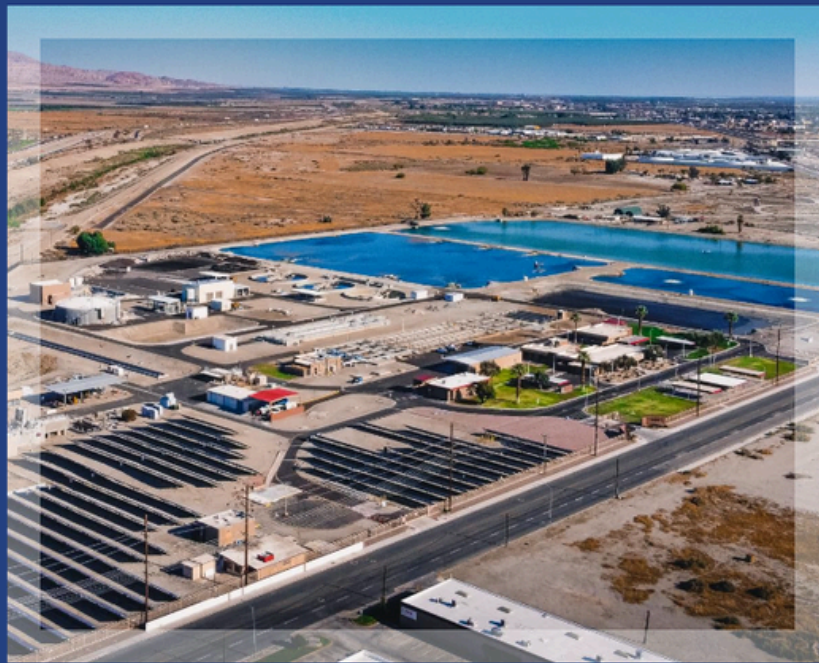
Vista aérea de las instalaciones de regeneración de agua y del edificio administrativo de Valley Sanitary District.

Boletín informativo del Gerente General Abril de 2024